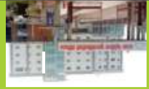
Dwaraka Metrohills Superspecialist Hospital