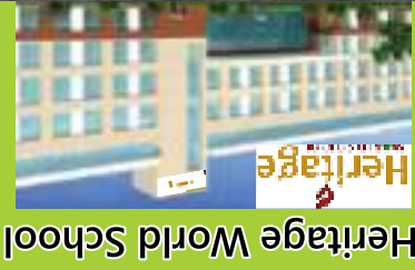
Heritage World School