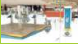
Bharat Petrol Pump